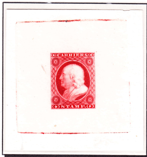
Essai de couleur sur papier velin (ref. L01TC5a)

Réimpression effectuée en 19 mai 1903, à partir d'un poinçon créé à partir de trois morceaux de poinçons ayant servi à imprimer des timbres chiffrés (à 3, 12 et 30c), le poinçon original ayant été égaré !