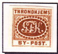
papier plus épais