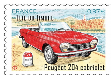
Le timbre de feuille Phil@poste 2020