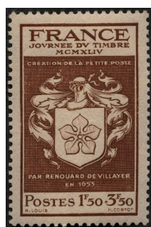
Dessiné par R. Louis Gravé par H. Cortot

Après la Seconde Guerre mondiale, qui a interrompu la « Journée du Timbre » dans son élan, le nombre de villes organisatrices - et le public- n'a cessé d'augmenter. Jusqu'à représenter de nos jours près de 100 villes et des milliers de participants réunis chaque année sur tout le territoire.