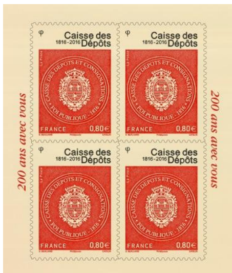
Le bloc de 4 timbres imprimé en taille-douce sur support bio-sourcé 20 000 exemplaires