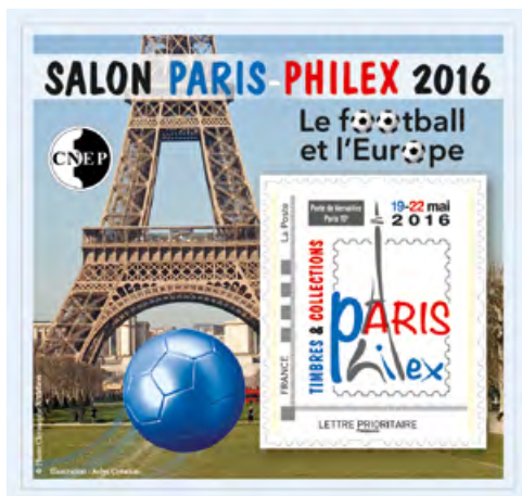
Le bloc CNEP avec un ID timbre