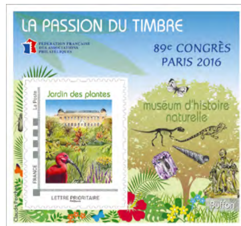
Le bloc FFAP avec un ID timbre

Maryline GUILLET Tél. : 01 41 87 42 33 ou 06 32 77 39 65 maryline.guilet@laposte.fr