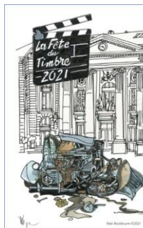
Enveloppe du Bloc FFAP 2021

Et pour tous les cinéphiles et amoureux de voitures anciennes : à noter également la présentation de la véritable 2CV du film « Le Corniaud » à Beville le Comte (28700).