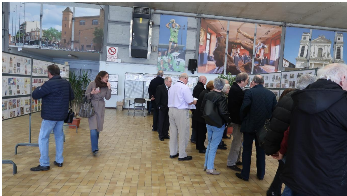
La visite des collections commence avec les officiels

Un week-end de fête qui restera à jamais dans nos mémoires, sous le signe de la convivialité et de l'espoir d'une renaissance de notre passion.