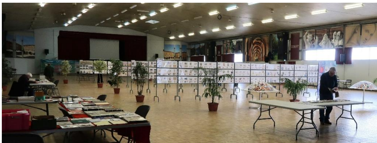
La salle des fêtes du Marché Gare de Montauban