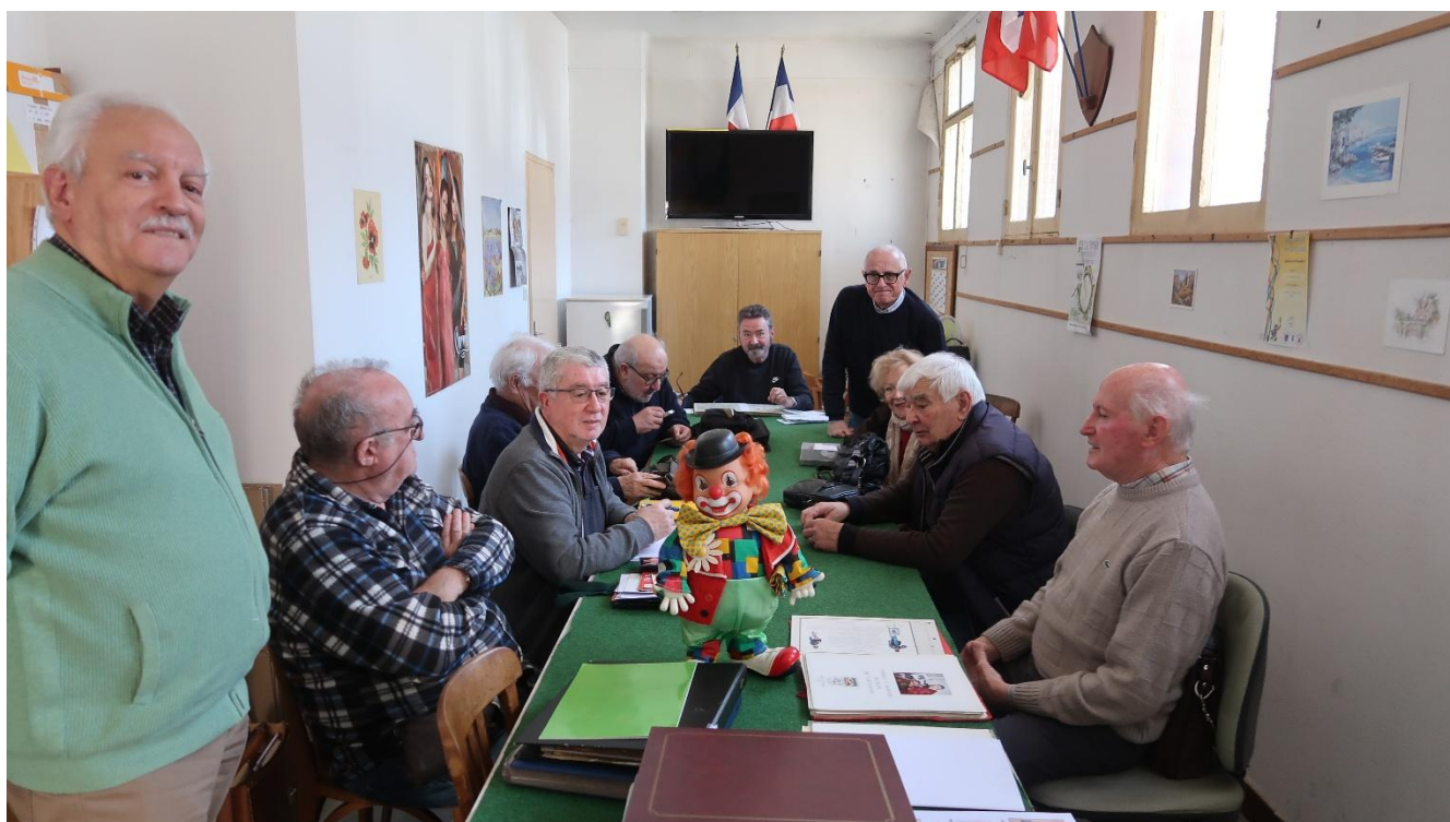
Réunions du CPM (en bas le 01 er jeudi 14h00/17h00 _en haut le 03 ième jeudi de 20h00 à 22h00)